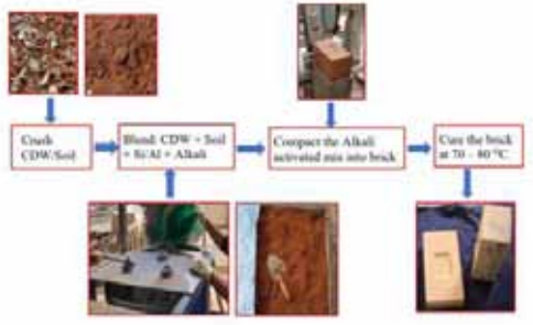
Low-C brick production