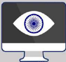
National Intelligence Grid (NATGRID)

இதனை செயல்படுத்துவதற்கு தேவையான அனைத்து அடிப்படை கட்டமைப்புகளும் செய்யப்பட்டு வருகின்றன.