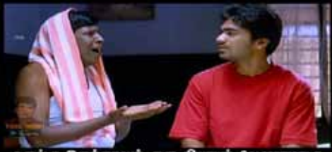
உருட்டா இருந்தாலும் ஒரு நியாயம் வேணாமாடா

துளியும் ரத்தம் சிந்தாமல் ஆப்காளை கைபற்றியது எப்படி?