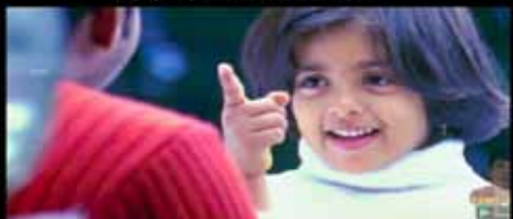
உங்க உருட்டு க்யூட்டா இருக்கு

பெண்கள் பர்தா அணியவும் கால் தெரியாமல் நடக்கவும் உரிமைகள் கொடுத்த தாலிபான்கள்.