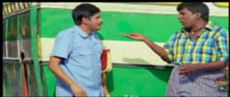
அது சரி.. உங்க வாயி.. உங்க உருட்டு..

அசால்ட்டாக ஆப்காளை கைப்பற்றிய தாலிபான்கள்