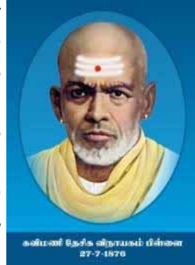
கவிமணி தேசிக விநாயகம் பிள்ளை 27-7-1870

சொல் அமுதாய் இனிக்கும் எளிமையும் இனிமையும் நிறைந்த 'மலரும் மாலையும்' என்ற கவிதைத் தொகுப்பை கவிமணி வழங்கினார். அதனால் தமிழறிஞர்கள் குழு அவருக்கு 'கவிமணி' என்ற பட்டத்தை வழங்கியது. அத்தொகுதியில் “அப்பம் திருடின எலி”, “பசுவும்