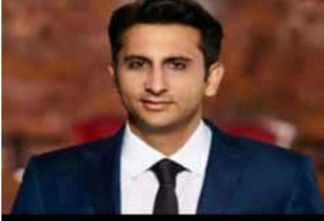
இவர் சீன தடுப்புகளுக்கு எதிராக களம் காண்கிறார்