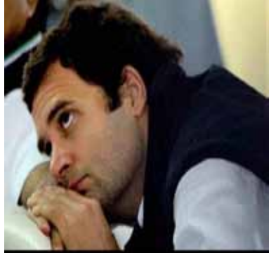
இவரோ சீனாவுக்கு ஆதரவாக இவர்கள் மூவரை எதிர்க்கிறார்