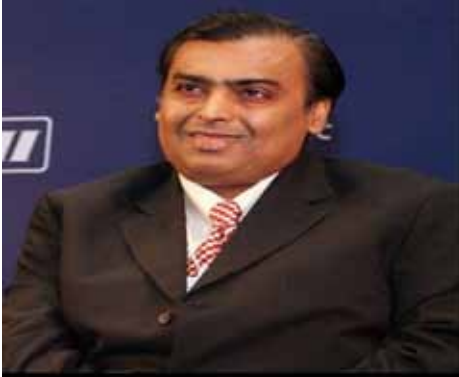
இவர் சீன 5 ஜி'க்கு எதிராக பணியாற்றுகிறார்