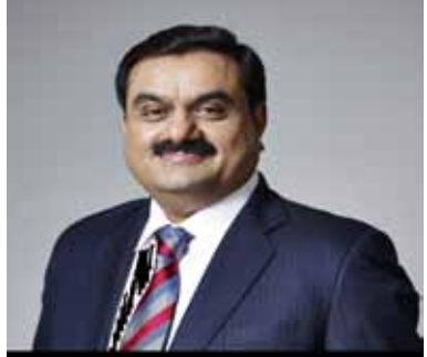
இவர் சீன துறைமுகங்களுக்கு எதிராக போராடுகிறார்